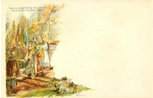
Ferencz József király koronázása