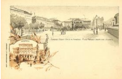
Budapest. Ferencz József tér és az Akadémia