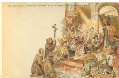
Szt. Atrik átnyújtja a Koronát Szt. Istvánnak