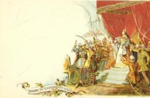
Moriamur pro rege nostro Maria Theresia