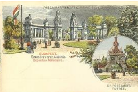
Ezredéves orsz. kiállítás: főbejárat