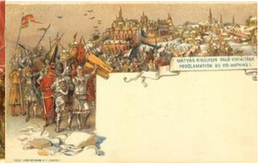
Mátyás királyá(!) való kikiáltása