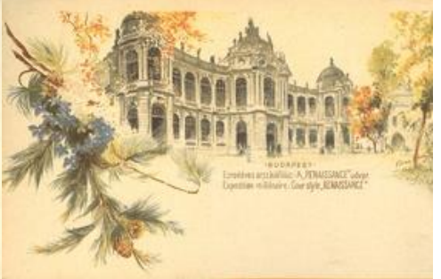
A "RENAISSANCE" udvar