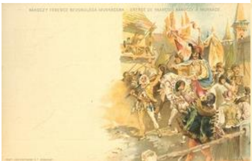
Rákóczy(!) Ferenc bevonulása Munkácsra