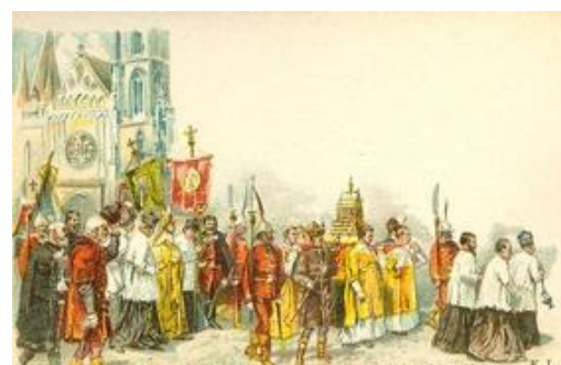
Szt. István napi körmenet