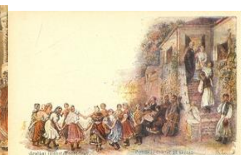
Aratási jelenet Nógrádban