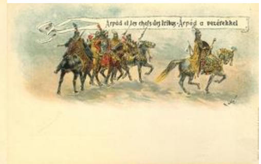
Árpád a vezérekkel