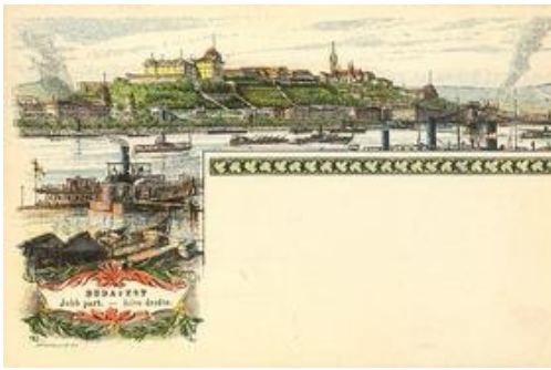
Budapest. Jobb part