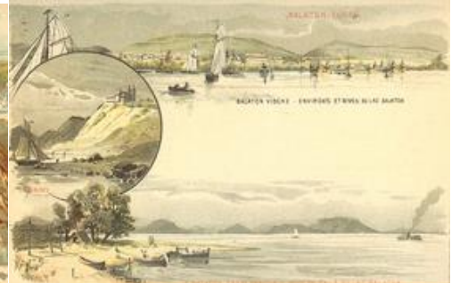
Balaton-Füred, Tihany, a Balaton zalai partja