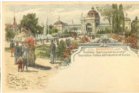
Kiállítás: Iparcsarnok és a corso