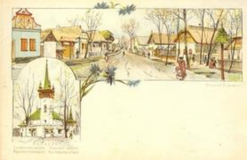
Magyar utca és a templom