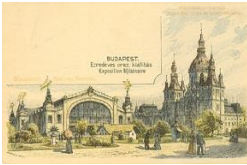
Ezredéves orsz. kiállítás: Gépcsarnok