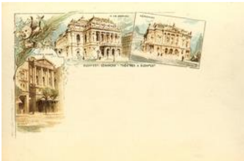
Operaház, Népszínház, Nemzeti Színház